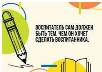
Рис. П2.2. Пример карточки с цитатой