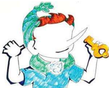
Рис. П2.3. Пример «Буратино»