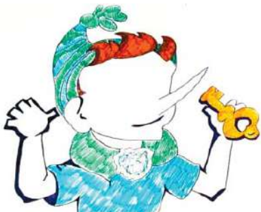
Рис. П2.3. Пример «Буратино»